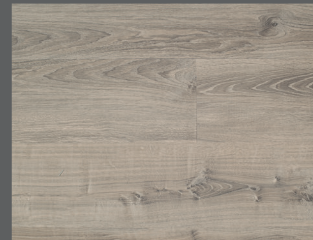
Alaska D5106 (DryBack) / C5106 (Clic)