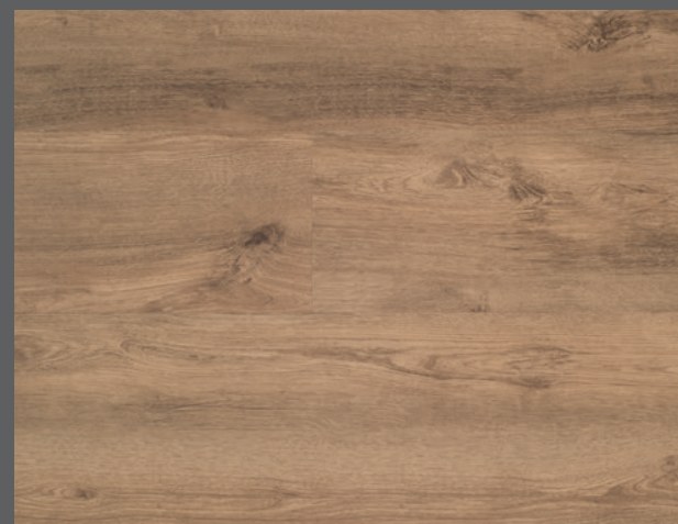
Tradition D5211 (DryBack) / C5211 (Clic)