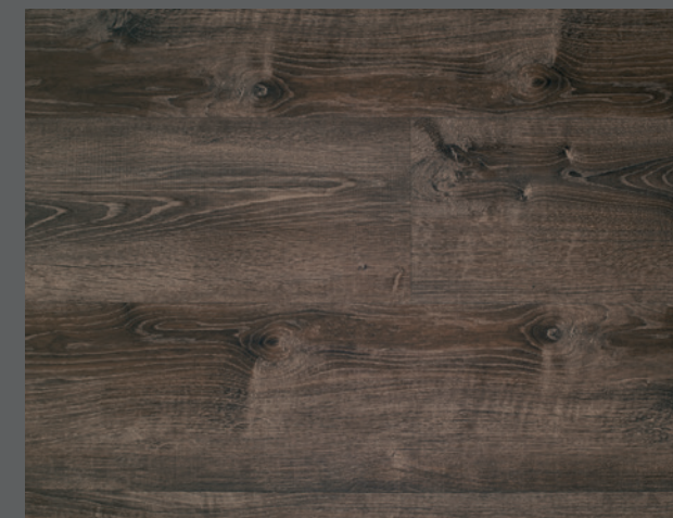
Dark D5104 (DryBack) / C5104 (Clic)

Diese Fotos wiedergeben nur einen kleinen Teil des Designs. Farben und Schattierungen können variieren. Ces photos ne représentent qu'une petite partie du décor. Les coloris et les nuances peuvent varier.