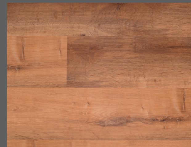
Chelsea D5110 (DryBack) / C5110 (Clic)