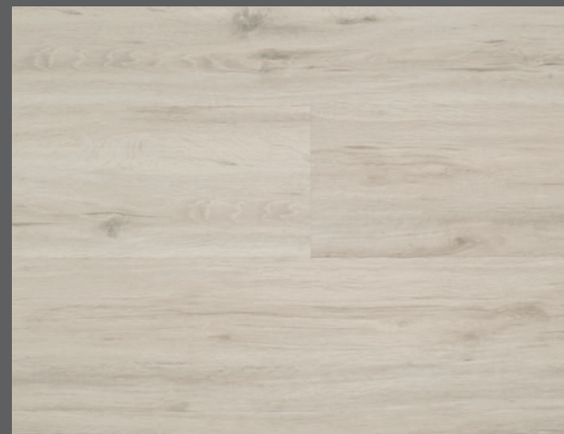
Ascot D5514 (DryBack) / C5514 (Clic)