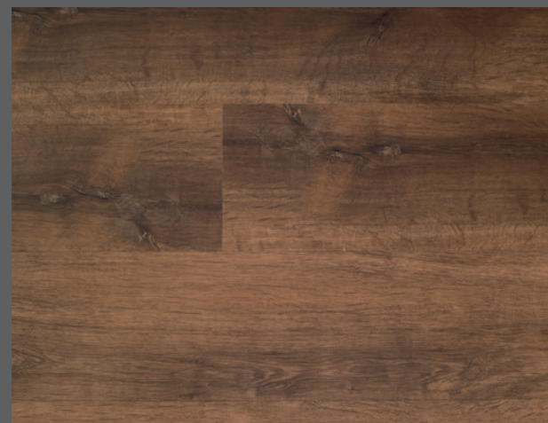
Mocca D5113 (DryBack) / C5113 (Clic)